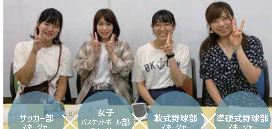
サッカー部 マネージャー

スポーツの秋ということで、今回は日々選手たちを支える宇大運動部のマネージャー4人に集まっていただきました！マネージャー同士だから話し合えること、沢山語っていただきましょう！